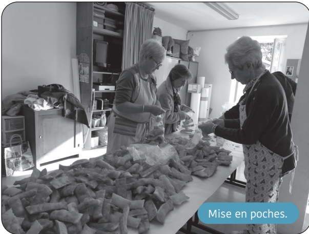
Mise en poches.