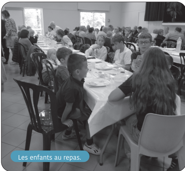
Les enfants au repas.