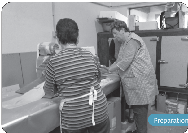
Préparation des merveilles.