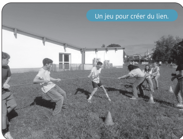
Un jeu pour créer du lien.

Jeudi 18 septembre 2025, le lycée a organisé une grande journée de regroupement placée sous le signe de la convivialité et du partage. L'objectif était clair : créer du lien entre les élèves de différentes classes, renforcer la cohésion et la communication, et permettre à chacun de découvrir de façon ludique ses camarades mais aussi les adultes du lycée.