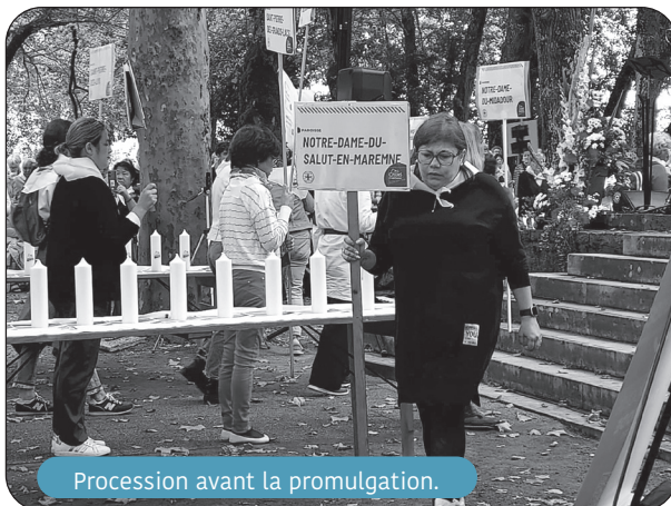
Procession avant la promulgation.