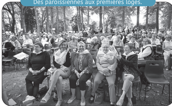
Des paroissiennes aux premières loges.