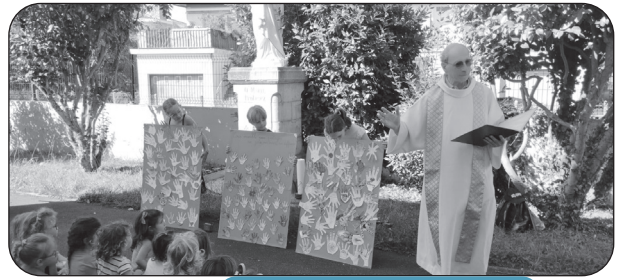
Célébration de rentrée.

Les panneaux réalisés par les élèves à l'occasion