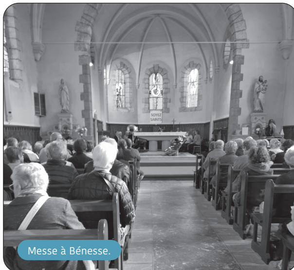
Messe à Bénesse.

En amont, crêpes et merveilles étaient confectionnées en vue de la vente ; de même, les préparatifs pour le jour J (mise en place des tables et chaises, nappes et couverts, stocks boissons/denrées, etc.). Le matin, les bénévoles (précieux) s'activaient pour la préparation du repas. Pendant ce temps, à 10h30 dans l'église débutait la messe, au son de la musique interprétée par « La Bénéssoise ».